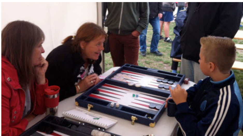
Også de unge kiggede forbi