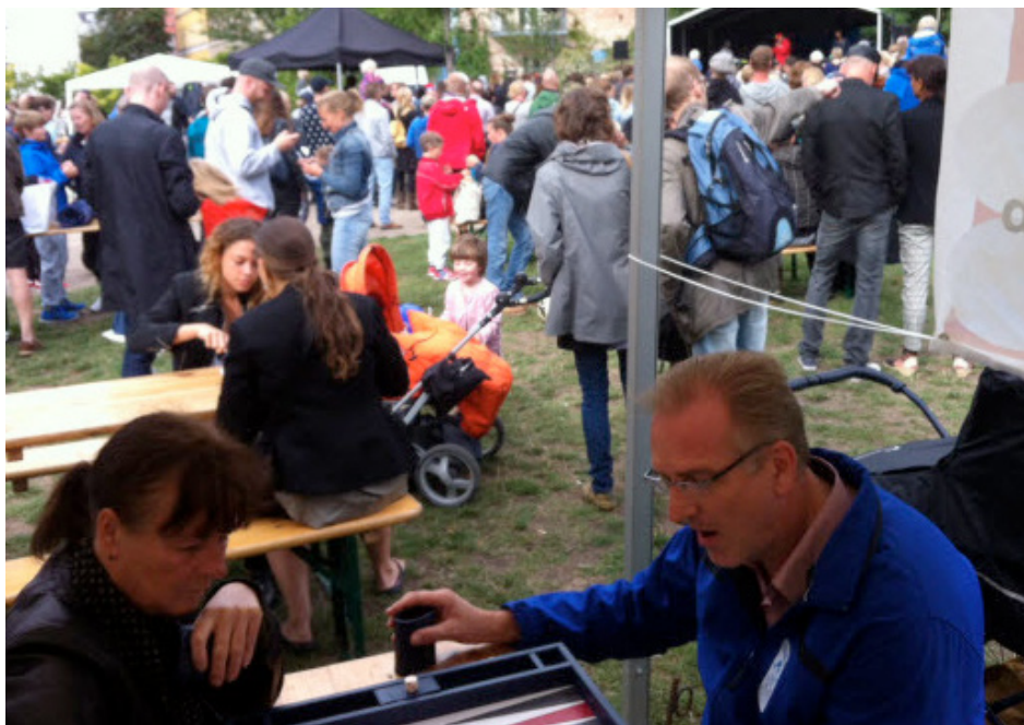
Mange kiggede forbi