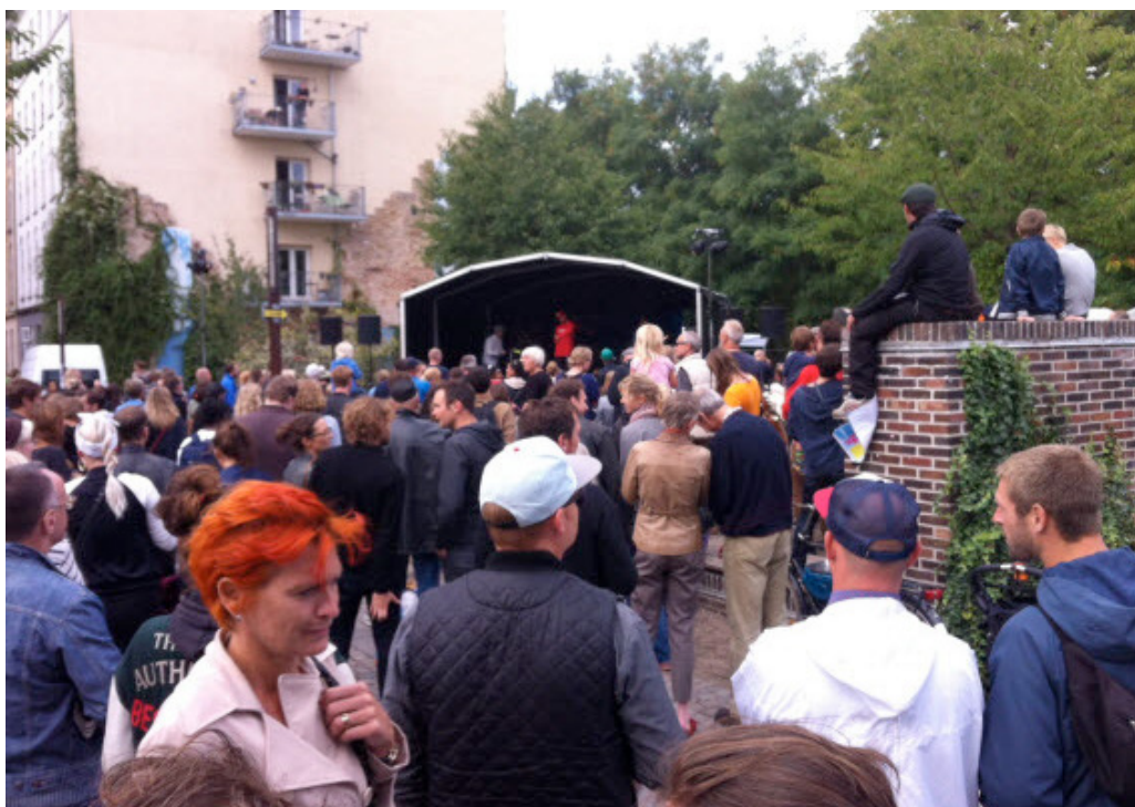
Musik og gæster